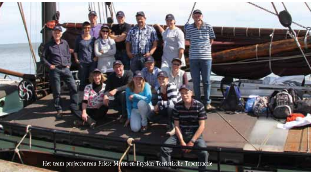
Het team projectbureau Friese Meren en Fryslân Toeristische Topattractie

Het projectbureau Friese Meren gaat vanaf nu nog meer samenwerken met het provinciale Programma Fryslân Toeristische Topattractie. Dit programma voor toeristische ontwikkeling van Fryslân richt zich vooral op de Wadden, de Elfsteden, Friese Meren en het subprogramma Friese Wouden. Er wordt gewerkt aan het verder versterken van de organisatiestructuur binnen de provincie Fryslân op het gebied van recreatie en toerisme. Een integratie van beide programma's ligt dan ook voor de hand.