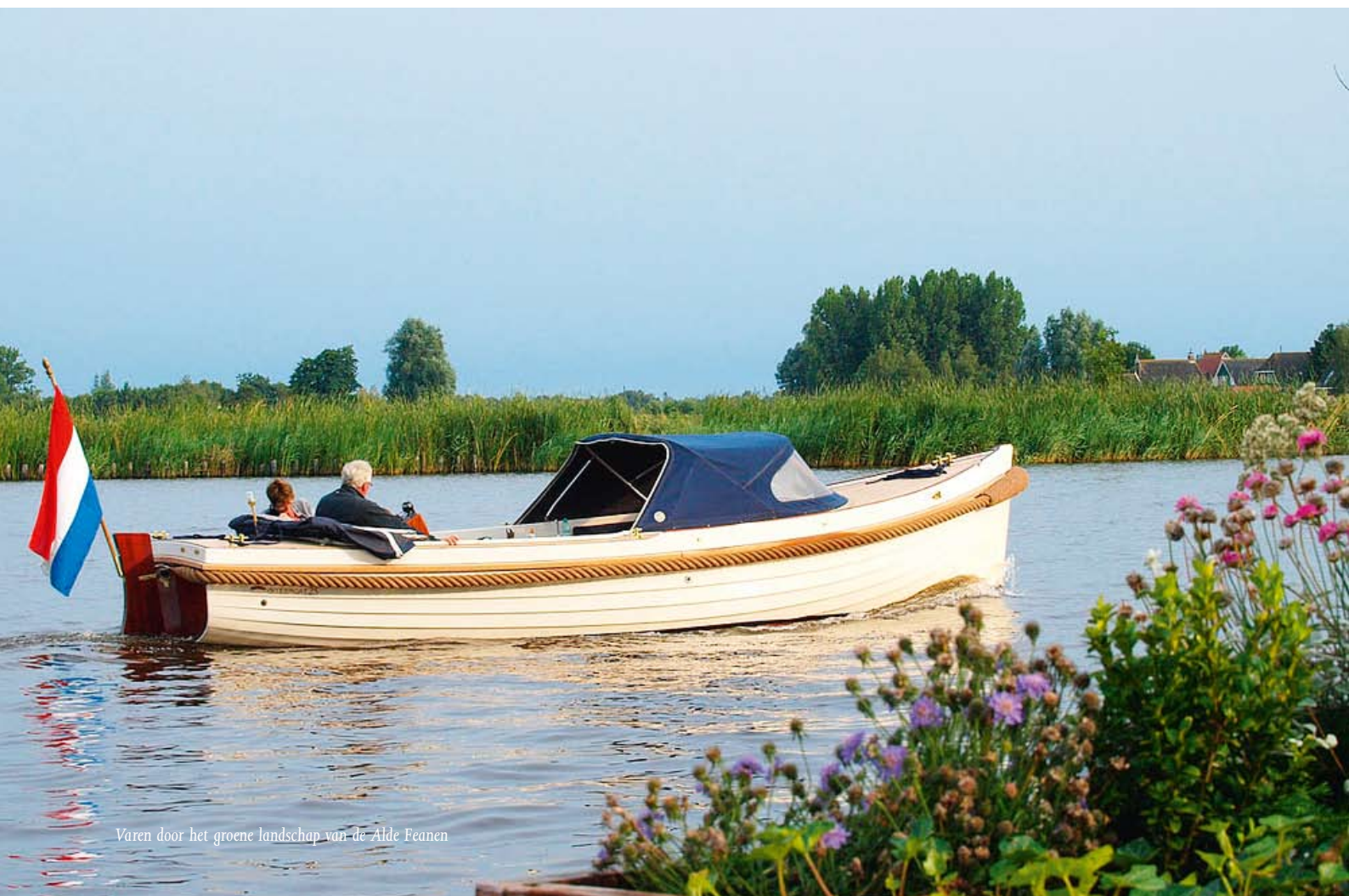
Varen door het groene landschap van de Alde Feanen

Hulsman is onder de indruk van de krachten die loskomen bij het opstellen van de masterplannen. "Wat eerder al in Wymbritseradiel gebeurde en nu ook in Harlingen en Earnewâld, is het voorbeeld van een breed gedragen visie waarbij met overheidsgeld en private investeringen, samengewerkt wordt om de waterrecreatie in Fryslân een flinke impuls te geven. Waar wij allemaal de vruchten van kunnen plukken."